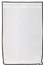
Bag bach gwyn