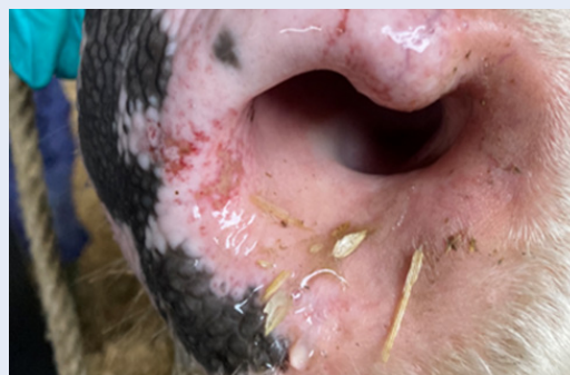
Briwiau yn y ffroenau