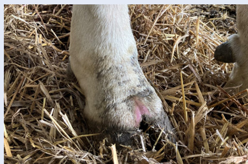
Hollt y carn yn goch