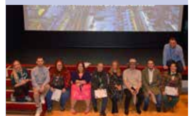
Pobl ifanc yn gwneud ffilm am eu Blaenau Gwent nhw gweler tudalen 3