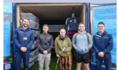
Trydedd ystafell citiau gymunedol yn agor gweler tudalen 6