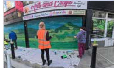
Trawsnewidiad i dref Abertyleri gweler tudalen 7