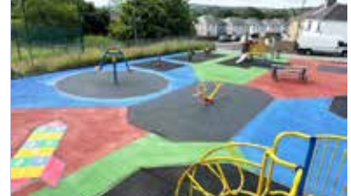
Mannau chwarae i'w hadnewyddu gweler tudalen 4